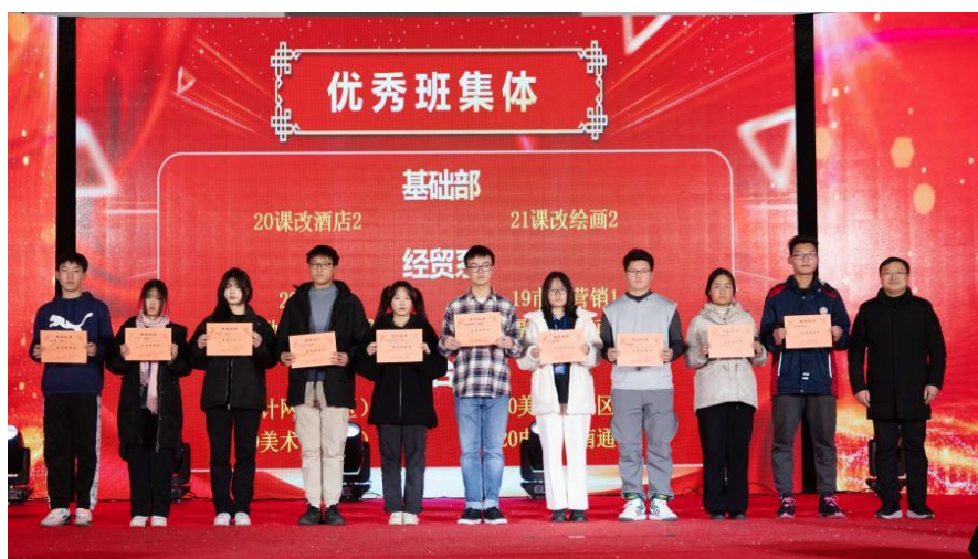
成长德育：成长年报优秀班集体颁奖

通过抓好制度建设和具体工作落实，取得初步成效：1、有效提升学生自我提升的能力。今年全校学生以“善念”、“善行”、“善言”为主要内容，撰写善行日志近2.6万篇，记录品格培育、道德提升的成长过程。2、涌现一大批先进典型。今年评出学生“系部善行之星”135名、“校级善行之星”9名。通过表彰典型，在全校营造出“向上向善”的浓厚氛围。3、形成学校内涵建设动力。开展各类文化体育健康向上的活动100余场次，学生价值观的形成，学生的主动性，日常行为规范等方面取得了明显进步。