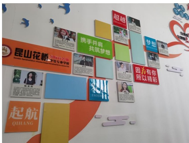
优秀毕业生照片墙