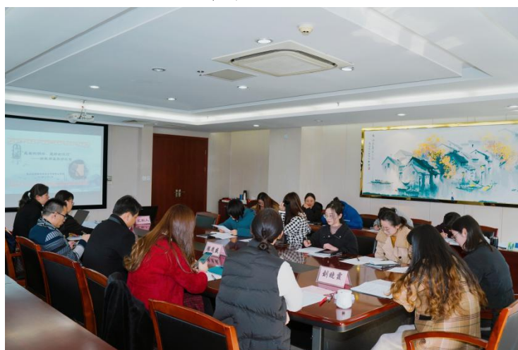
青年教师基本功竞赛