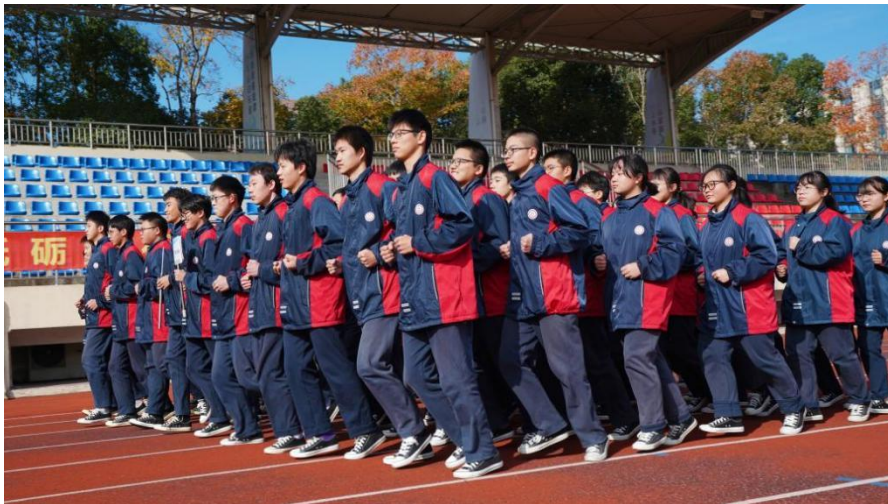
成长德育：阳光体育跑操比赛