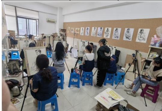
教师指导学生训练现场