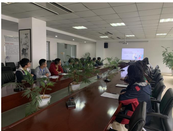
班级心理委员培训

近3年全校学生深入了解心理健康知识，来校咨询室的70人次，在学校专兼职心理老师的陪伴下，提升了自我探索，提升了自愈力，顺利度过一次次心理危机。