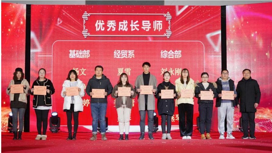
成长德育：成长年报优秀成长导师颁奖