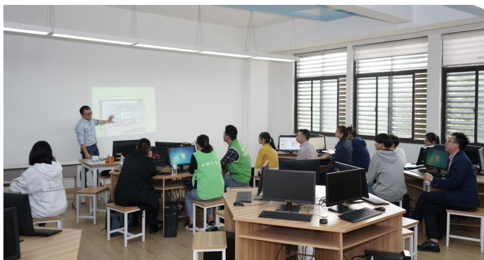
开展电商社会培训

一年来，学校电子商务专业与利丰供应链管理（江苏）有限公司合作建立了苏州市职业教育现代学徒制项目，探索校企双主体协同育人机制。学校电子商务专业被评为苏州市职业教育优质专业。学校承担电子商务专业相关领域社会培训 200 多人次。1 名教师在苏州市职业学校技能大赛电子商务项目中荣获一等奖，1 名教师荣获二等奖，1 名教师荣获三等奖，8 名学生荣获三等奖，其中 2 名教师晋级省赛。