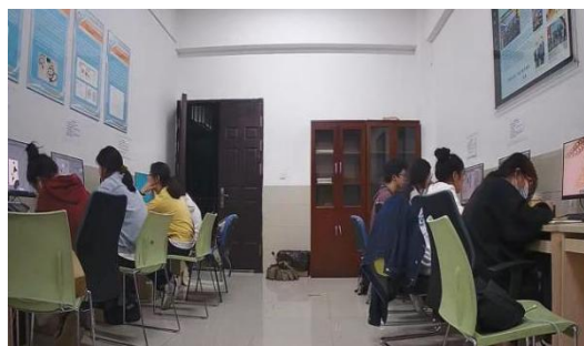
日常电脑设计训练