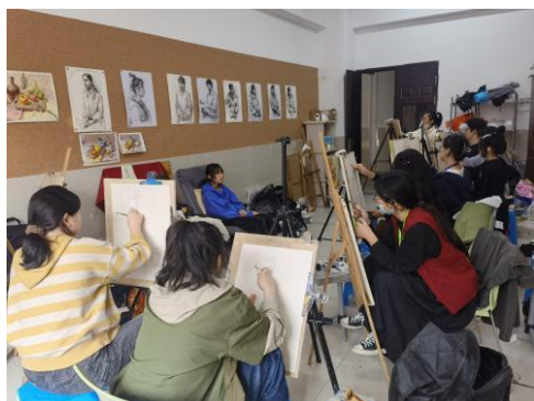
日常素描写生训练

技能训练队目前共有三个梯队 14 人，采用小班教学模式，其中 20 级 4 人，21 级 5 人，22 级 5 人。